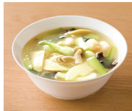
エビと野菜のあんかけ汁ツバ