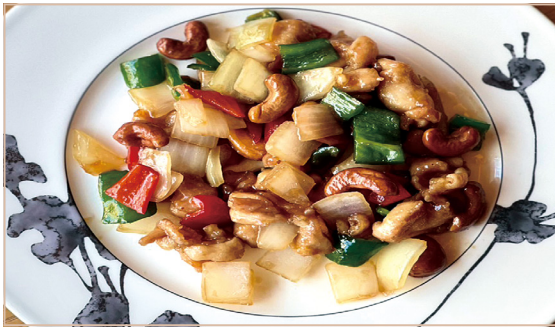
C. 鶏とカシューナッツの炒め