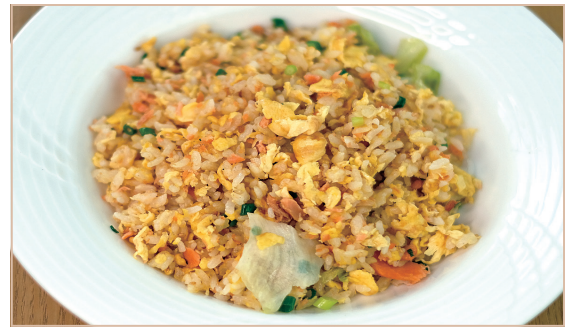
D. 秋鮭のチャーハン