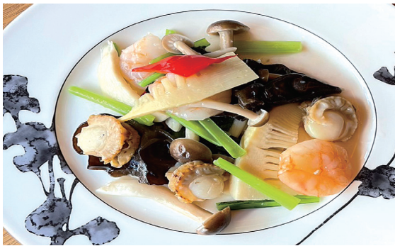
A. ホタテとエビの塩炒め

前菜盛り合わせ / 青菜の炒め / 点心3種盛り合わせ / 北京ダック / メイン料理 (A-Dから1品) / チャーハン / デザート / 食後の中国茶